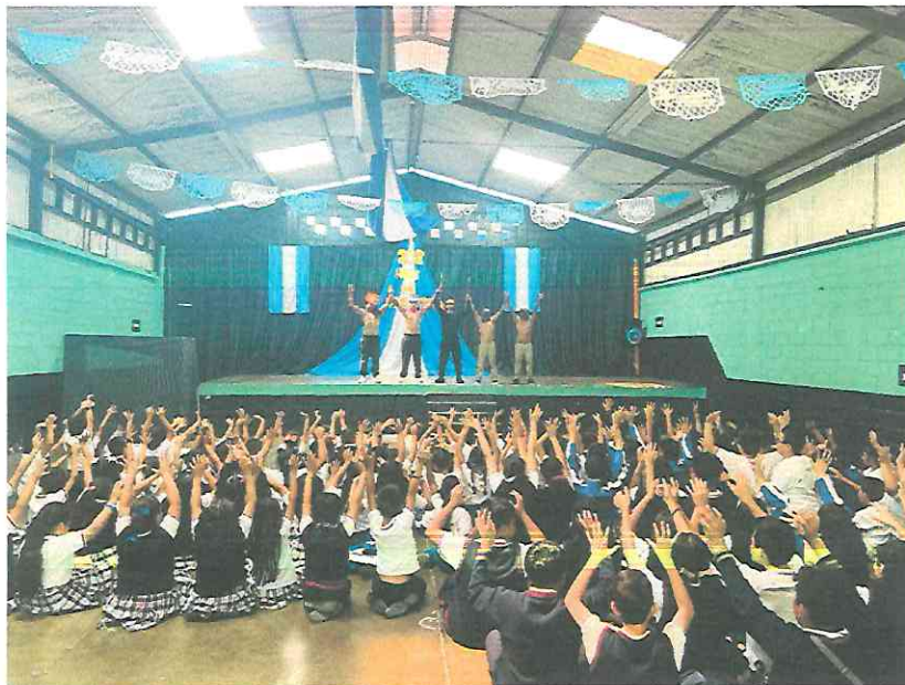
Fotografía después de finalizar el show con todos los niños