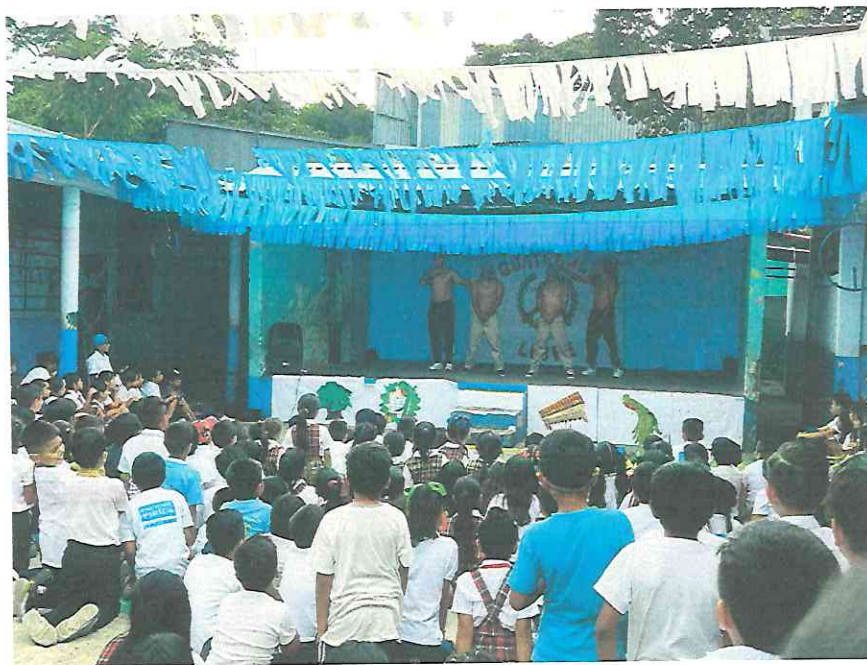
La hermanos de Hunahpú y Ixbalanquè están a punto de matar a los Señores de Xibalbá