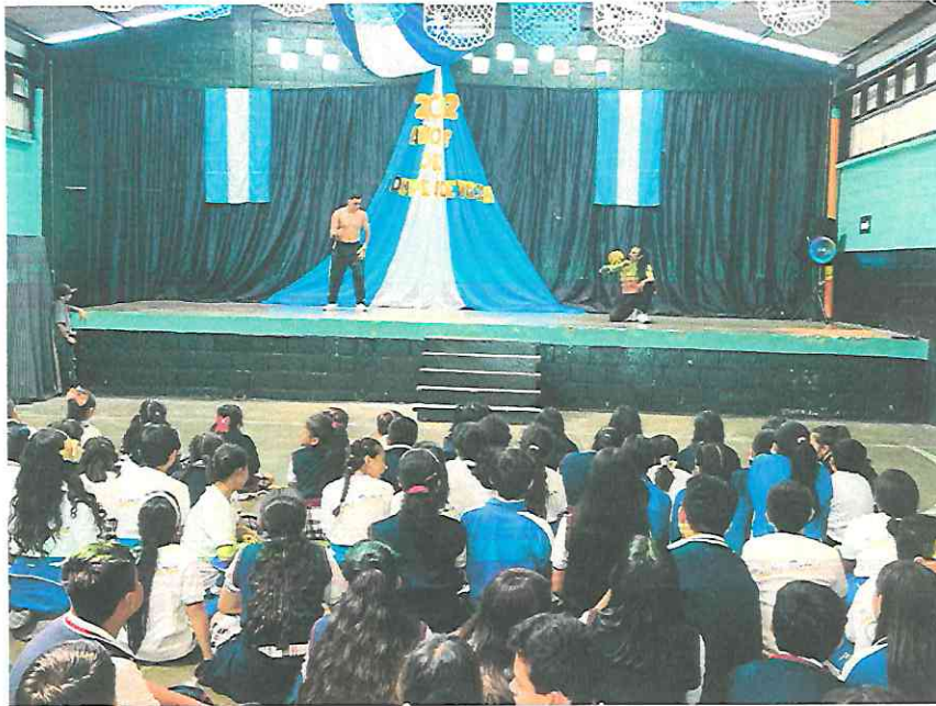
Los hermanos Hunahpú e Ixbalamqué descubren el juego a la Pelota Maya