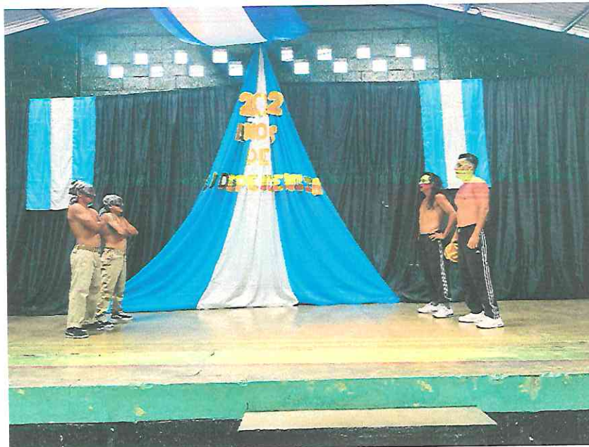
Los hermanos Hunahpú e Ixbalanqué se enfrentan con los Señores de Xibalbá