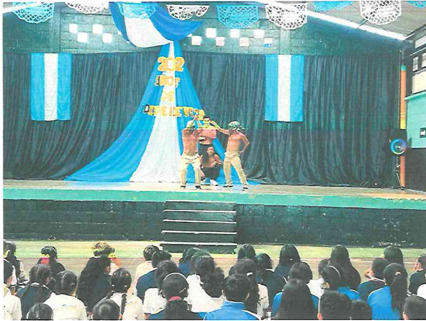
Los Señores de Xilbabá y Huanhpú e Ixbalanqué hacen un enfrentamiento.