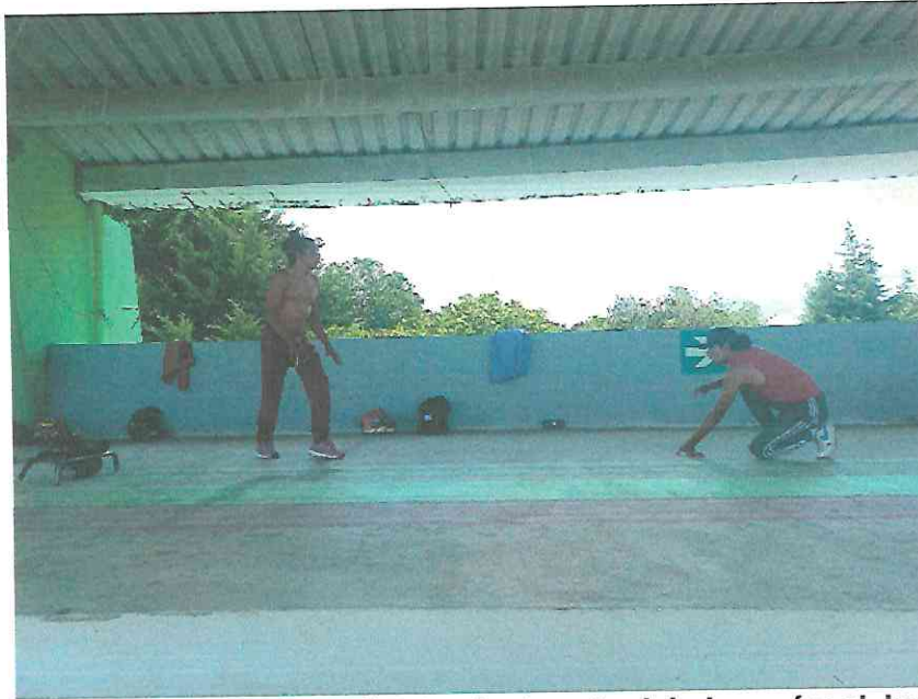
Ensayando la parte del enfrentamiento entre Ixbalanqué y el Jaguar