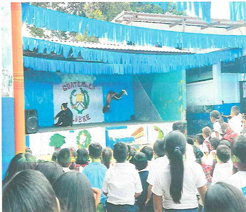
Ixbalanqué se enfrenta al Jaguar