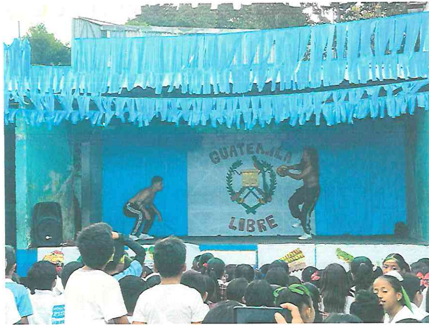
Los hermanos Hunahpú e Ixbalamqué juegan a la Pelota Maya