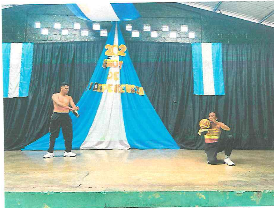
Probando los implementos del Juego de Pelota Maya