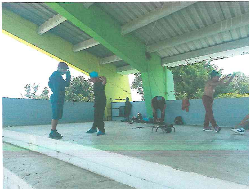
Preparándose para la batalla del Juego Pelota Maya