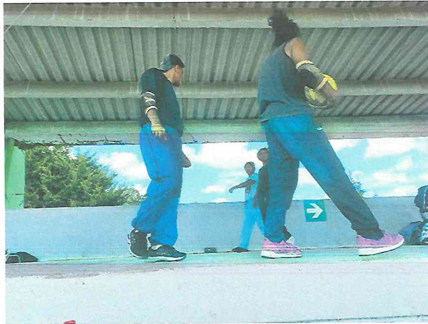
Ensayando el encuentro entre los Señores de Xilbalbá y los hermanos Hunahpú e Ixbalanqué