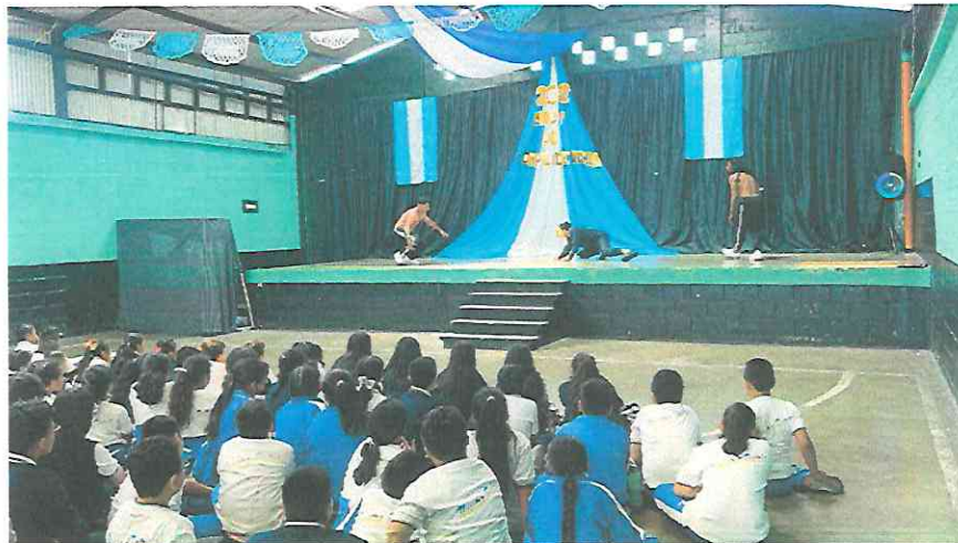
Los hermanos Hunahpú e Ixbalamqué se enfrentan a la cueva del jaguar.